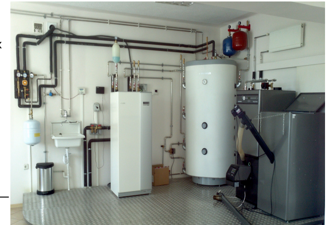
Типова схема підключення геотермального теплонасосу в парі з твердопаливним котлом

Проектування, поставка, монтаж, сервісне обслуговування